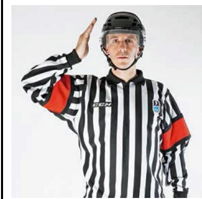
Checking to the Head - CHECK-H

De scheidsrechter beweegt met open handpalm naar de zijkant van het hoofd.