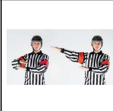
Delaying the Game - DELAY

De scheidsrechter houdt de handen boven elkaar om vervolgens de rechterarm naar rechts te zwaaien. Let op! Alleen voor het buiten het speelveld schieten van de puck.