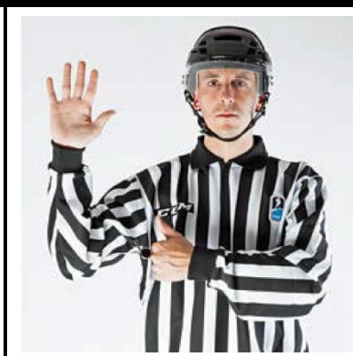
Too Many Players - TOO-M

De scheidsrechter geeft met zes vingers (een open hand) het teken voor de borst.