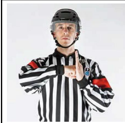
Boarding - BOARD

De scheidsrechter slaat voor de borst met gebalde vuist tegen de gestrekte handpalm van de andere hand.