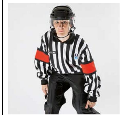
Clipping - CLIPP

De scheidsrechter slaat met de zijkant van de open hand in de knieholte.