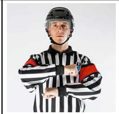
Charging - CHARG

De scheidsrechter draait de armen met samengebalde vuisten voor de borst om elkaar heen.