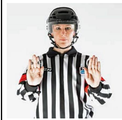
Checking from Behind - CHECK-B

De scheidsrechter maakt met open handpalmen een beweging naar voren.