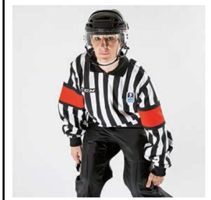
Clipping - CLIPP

De scheidsrechter slaat met de zijkant van de open hand in de knieholte.