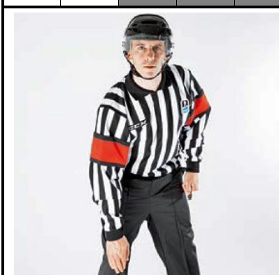
Kneeing - KNEE

De scheidsrechter brengt een open handpalm naar de knie.