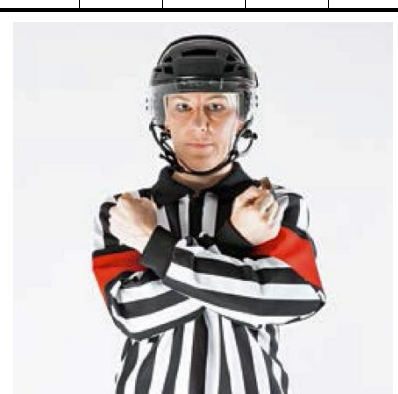
Interference - INTERF

De scheidsrechter houdt beide armen met gebalde vuisten kruislings voor de borst.