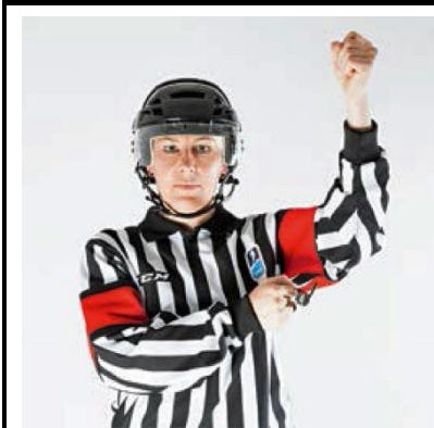
High Sticking - HI-ST

De scheidsrechter brengt samengebalde vuisten boven elkaar ter hoogte van het voorhoofd.