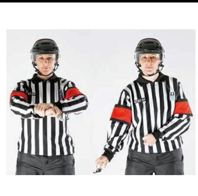
Holding the Stick - HOLD-S

Eerst geeft de scheidsrechter het holding teken. Vervolgens wordt een teken gegeven waarbij het lijkt of de stick op normale wijze wordt vastgehouden.