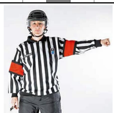
Roughing - ROUGH

De scheidsrechter brengt een arm met gebalde vuist zijwaarts.