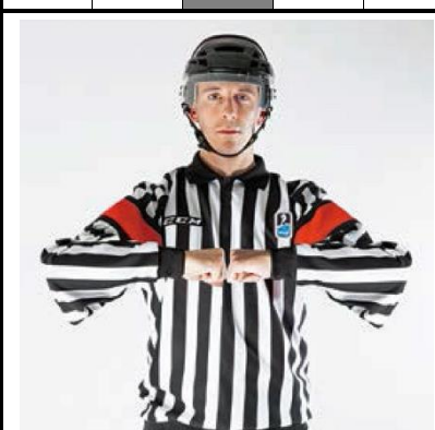
Late Hit - L-HIT

De scheidsrechter beweegt beide vuisten naar elkaar toe voor de borst.