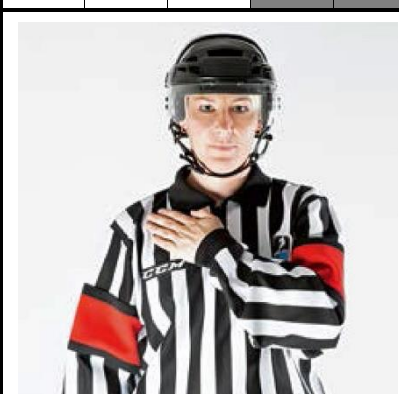
Illegal Hit - ILL-HIT

De scheidsrechter plaatst de platte hand op de andere schouder.