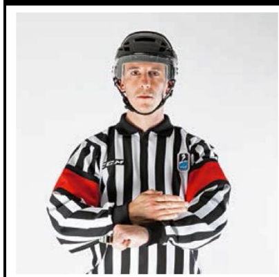
Slashing - SLASH

De scheidsrechter maakt met de zijkant van de open hand een slaande beweging op de pols van de andere arm.