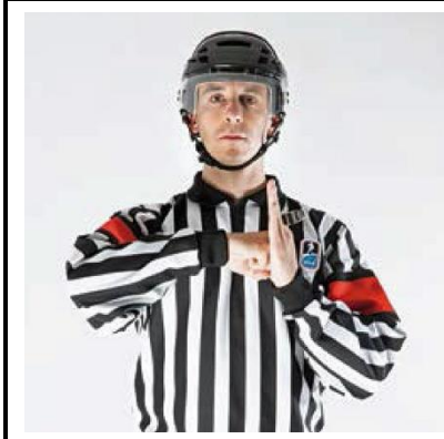
Boarding - BOARD

De scheidsrechter slaat voor de borst met gebalde vuist tegen de gestrekte handpalm van de andere hand.