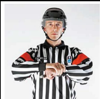
Holding - HOLD

De scheidsrechter houdt met de ene hand de pols van de andere arm vast.