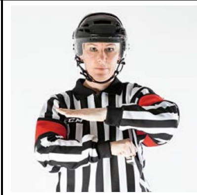
Butt Ending - BUTT

De scheidsrechter beweegt voor de borst beide armen over elkaar heen. De ene hand is gestrekt, de andere vormt een vuist.