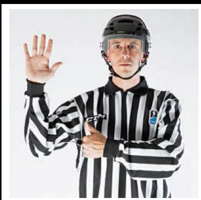
Too Many Players - TOO-M

De scheidsrechter geeft met zes vingers (een open hand) het teken voor de borst.