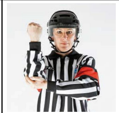
Elbowing - ELBOW

De scheidsrechter brengt de volle open hand naar de elleboog van de andere arm.