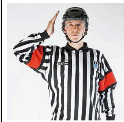
Checking to the Head - CHECK-H

De scheidsrechter beweegt met open handpalm naar de zijkant van het hoofd.