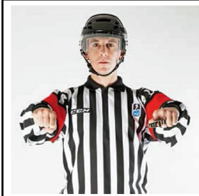
Cross-Checking - CROSS

De scheidsrechter houdt de handen met samengebalde vuisten op ongeveer een halve meter afstand van elkaar. Vervolgens wordt voor de borst een duwende beweging naar voren gemaakt.