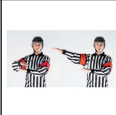
Delaying the Game - DELAY

De scheidsrechter houdt de handen boven elkaar om vervolgens de rechterarm naar rechts te zwaaien. Let op! Alleen voor het buiten het speelveld schieten van de puck.