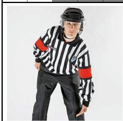
Tripping - TRIP

De scheidsrechter slaat met de hand onder de knie.