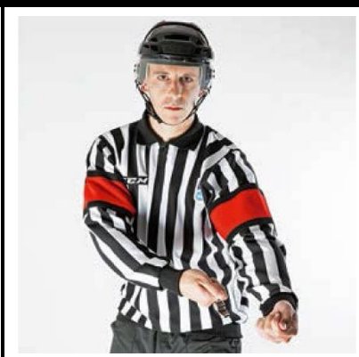
Spearing - SPEAR

De scheidsrechter maakt met beide armen een stekende beweging zijwaarts.